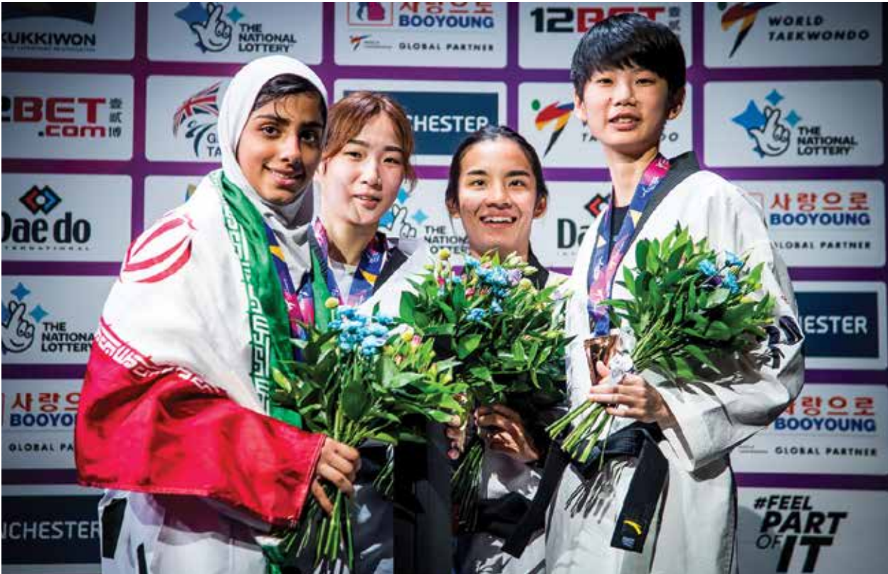
بدون شک بیست و چهارمین دوره مسابقات تکواندو قهرمانی جهان در منچستر انگلیس یکی از پرحاشیه ترین و عجیب ترین دوره های برگزار شده در تاریخ این مسابقات بود. میزبانی که تمام هم و غم را صرف کارشکنی برای برخی تکواندوکاران جهان از جمله تیم مدعی ایران کرده بود و در نهایت با همین حربه توانست برای اولین بار در تاریخ برگزاری این مسابقات به مقام نایب قهرمانی جهان دست پیدا کند.

المپیک ریو و در راند طلایی به خاطر فشار روانی بیش از حد مغلوب شد تا از رسیدن به مدال بازماند. نمی توان کتمان کرد که مشکلات ایجاد شده برای اعضای تیم ملی در حساس ترین ساعات و روزهای قبل از مسابقات، فشار روحی و روانی زیادی به ملی پوشان کشورمان و کادرفنی وارد و در نهایت علاوه بر تاثیر روانی روی تکواندوکارانی که دچار مشکل شده بودند، تمرکز سایر ملی پوشان کشورمان را نیز برهم زد. بازیکنانی که با برنامه ریزی طبیعی در محل مسابقات حاضر شدند، اما به دلیل مشکلات، سرمربی کشورمان را در کنار خود نداشتند.