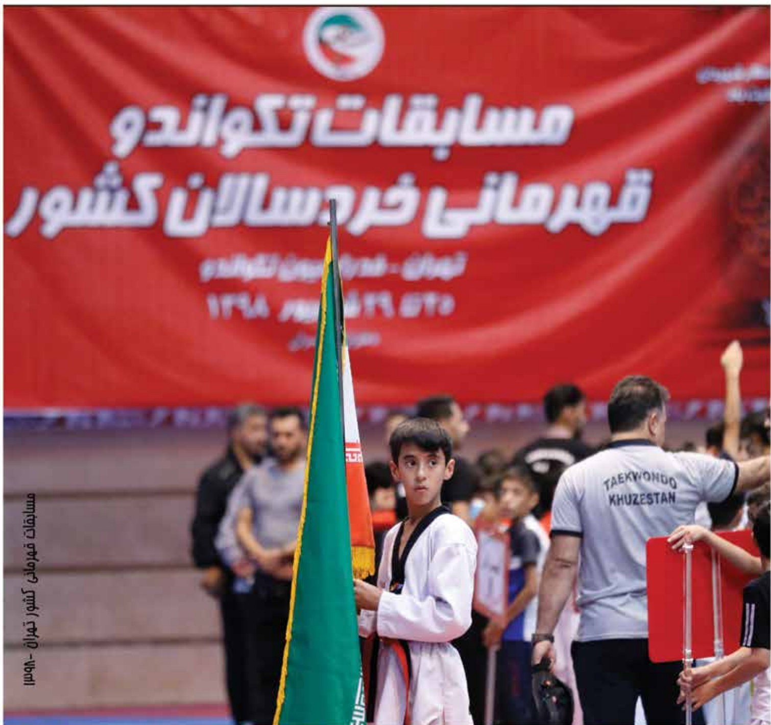
مسابقات قهرمانی کشور تهران - ۱۳۹۸