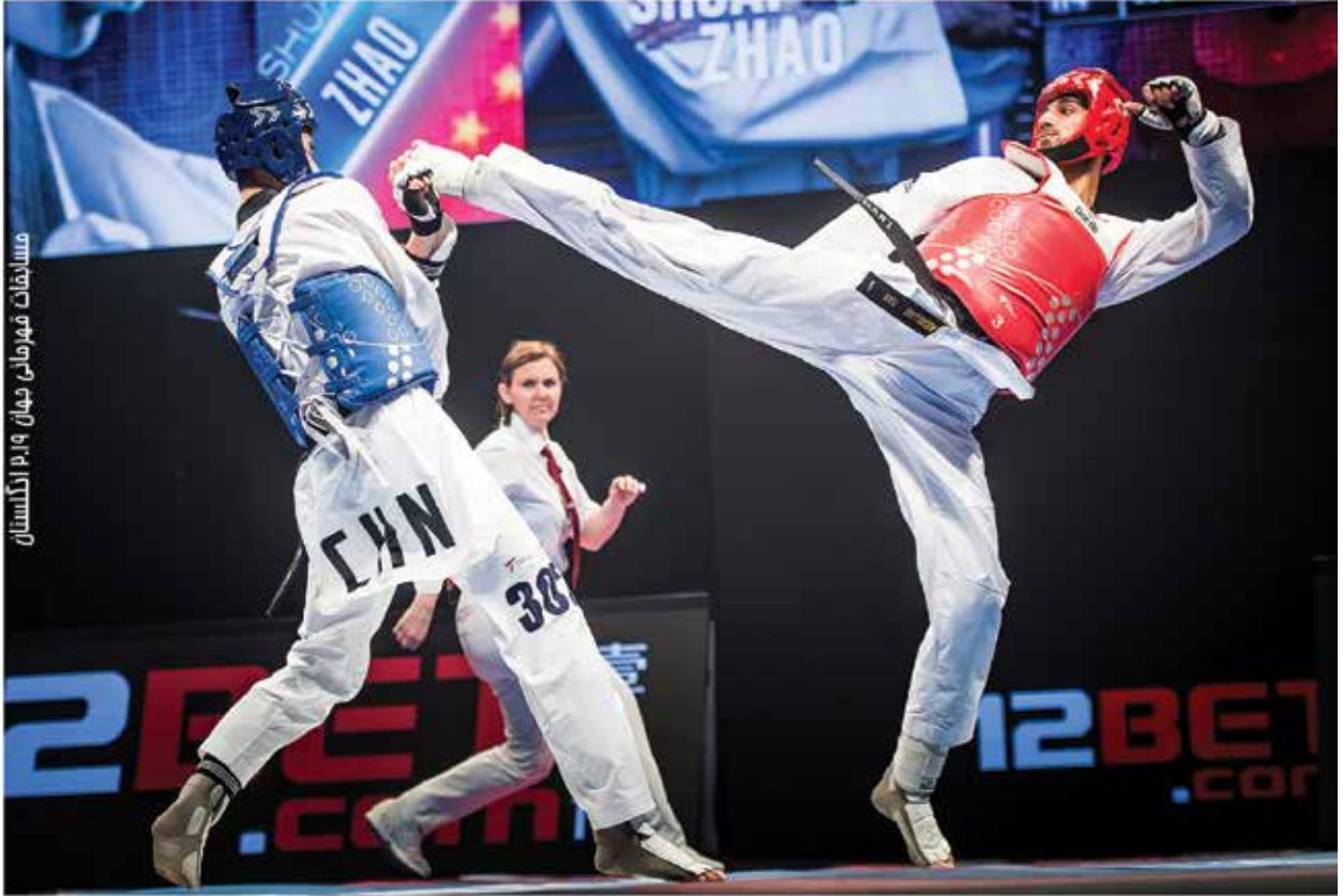
مسابقات قهرمانی جهان ۲۰۱۹ ازمکستان